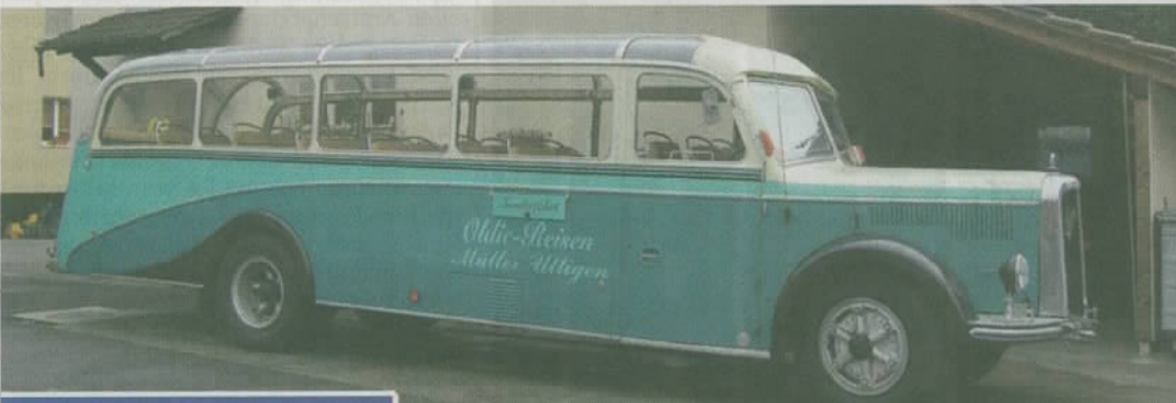
Saurer Panorama-Reisebus: Baujahr 1954, guter Zustand, Schätzpreis 100 000 Franken.

Mit diesen Wagen rollen Sie bei jedem Event in den Mittelpunkt und sorgen für Gesprächsstoff.