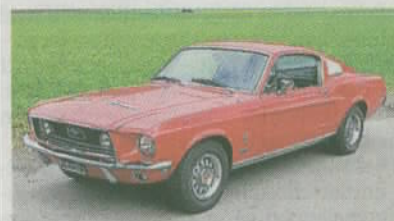
Ford Mustang GT 390 Fastback 1968 Handschalter in sehr gutem Zustand MFK als Veteran Schätzpreis CHF 58 000 bis 62 000