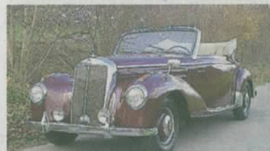
Mercedes 220 Cabriolet A 1952 Nur 1278 Stk. gebaut. MFK als Veteran. Schätzpreis CHF 100 000 bis 140 000