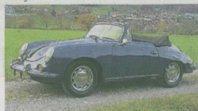
Porsche 356 SC 1965 Schweizer und Deutsche Wagenpapiere Schätzpreis CHF 90 000 bis 120 000