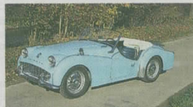
Triumph TR 3A 1960 Aufwändigst restauriert. MFK als Veteran. Schätzpreis CHF 45 000 bis 50 000