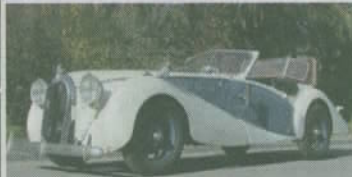
Talbot K75 Roadster: Baujahr 1927, originelle Karosserie, Schätzpreis 75 000 Franken.