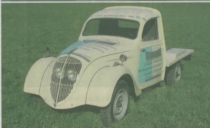
Peugeot 202 Camionette: Der Wagen wurde 1948 gebaut und ist als Werbeträger geeignet, Schätzpreis 9500 Franken.

Wenn Sie in der nächsten Saison mit Ihrem neuen Oldtimer auffallen wollen, dann ist für Sie der Besuch der Auktion «100 Klassische Automobile» am 1. Dezember 2007 in der Oldtimer Galerie Toffen bei Bern Pflicht. Die Autos, die wir Ihnen auf dieser Seite zeigen kommen unter anderem unter den Hammer, und wenn Sie der Meistbietende sind, dann haben Sie ein Automobil, das nicht an jeder Ecke steht. Und das mit Garantie!