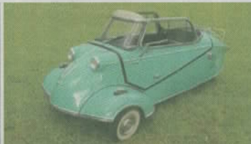
Messerschmitt KR 200: Kabinenroller, Baujahr 1960, Schätzpreis 36 000 Franken.

Eintritt ist gratis. Die Adresse: Gürbestrasse 1, 3125 Toffen. So kommen Sie nach Toffen: A6 Richtung Thun-Interlaken, Ausfahrt Rubigen-Belp, Richtung Riggisberg bis Toffen (jeweils eine Stunde ab Basel, Zürich oder Lausanne). Einen ersten Überblick bekommen Sie im Internet oder im Katalog, den Sie