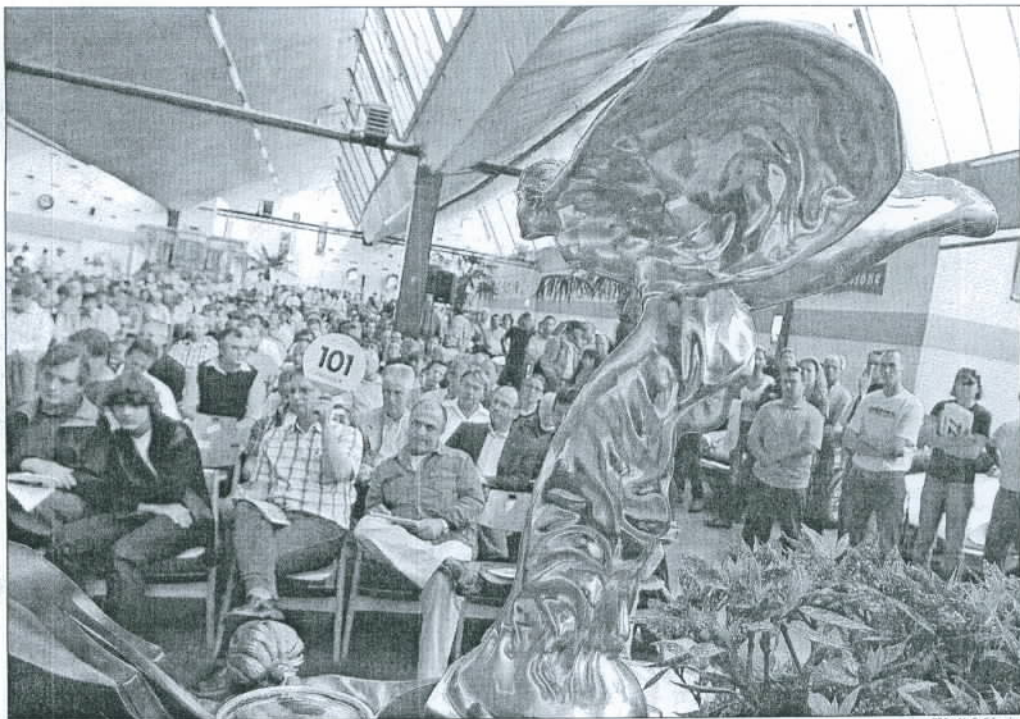
Emily, die Figur von Rolls Royce, schien den Überblick über das Auktionstreiben in Toffen jederzeit zu behalten.

Plötzlich verstummt das allgegenwärtige Gemurmel im Saal. Der Grund für die Spannung ist ein Kopf-an-Kopf-Bieten per Telefon. Zwei, dem Publikum unbekanntes Interessen-