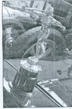
Rochet-Schneider: Engelsfigur stösst seit 1913 ins Horn.