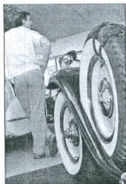
Cadillac Jahrgang 1929, Reserverad vorne.