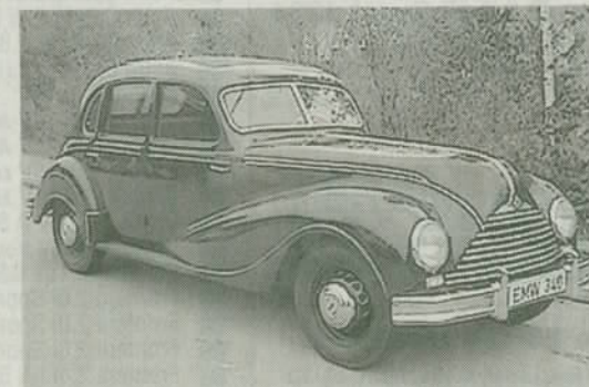
EMW 340 1952 Ostdeutscher BMW-Nachkomme; «E» stand für Eisenach statt für Bayern.