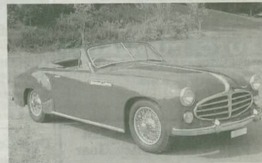
DELAHAYE 235 M 1953 Ein Repräsentant der diversen französischen Luxusportwagen der Nachkriegszeit, hier in Form eines Chapron-karossierten Cabrios.