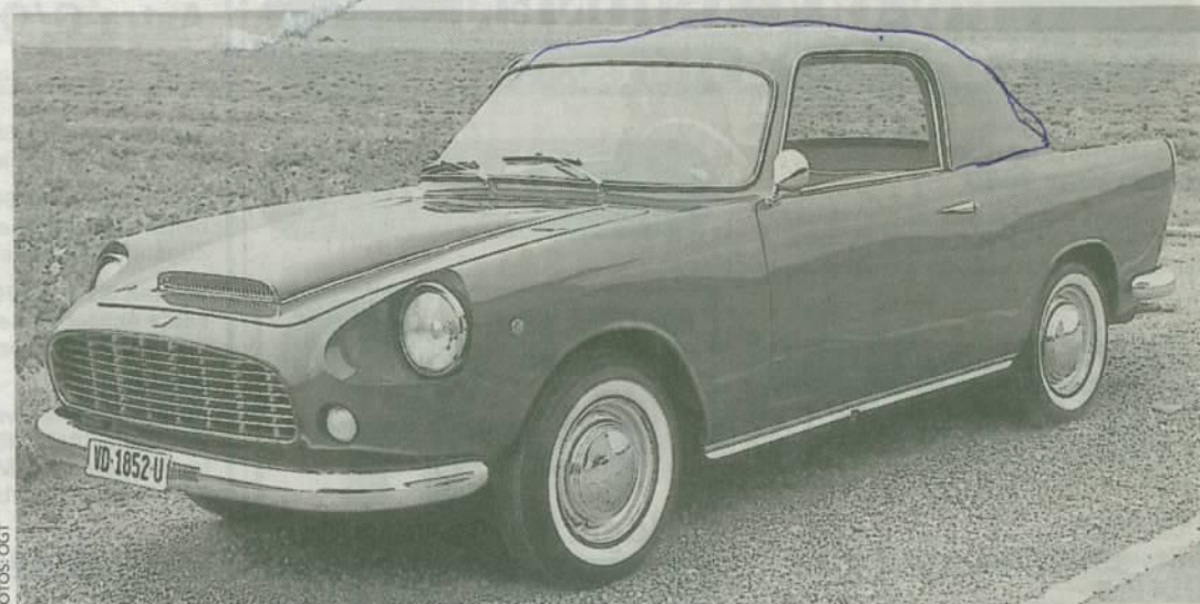
MORETTI 750 COUPÉ 1959 Adrettes Liebhaberstück mit der Zusatzbezeichnung Tour du Monde. Moretti hatte in der Nachkriegszeit individuelle Coupés und Cabrios in Kleinserie und Grossauswahl gebaut, deren Mechanik stets von Fiat-Modellen abgeleitet war.

Zu den besonderen Raritäten dürfen aus heutiger Sicht – nebst den bereits erwähnten Taunus 12 M und weiteren Wagen – auch etwa die folgenden Typen gezählt werden: 6-türiger Checker Aerobus 1963, Citroën DS 19 1964, Daimler Conquest Century II 1956, Delahaye 235 M Cabrio 1953, De Soto Airflow 1936, EMW 340 1952, Hispano-Suiza K6 Shooting Break 1937, Moretti 750 Coupé 1959, Peugeot 203 1958, Rolls-Royce 20/25 Landalette 1932, Rolls-Royce Phantom II 1933, Sunbeam Venezia 1966, Stutz Blackhawk VI 1977, Wolseley 15/50 1958. Eine reiche Auswahl echt seltener Modelle also, die «Toffen» diesmal in besonderem Mass zum wahren Raritätenkabinett stempelt. ♦