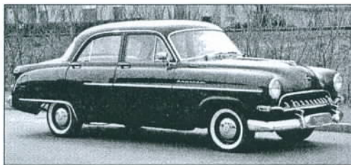
Opel Kapitän 1954 – Ein alter Bekannter (Schätzpreis Fr. 8000.– bis 12 000.–).

Die diesjährige Frühlingsauktion in Schmidlins Oldtimer-Galerie in Toffen wird am Samstag, 27. April, um 13.30 Uhr, in Szene gehen.